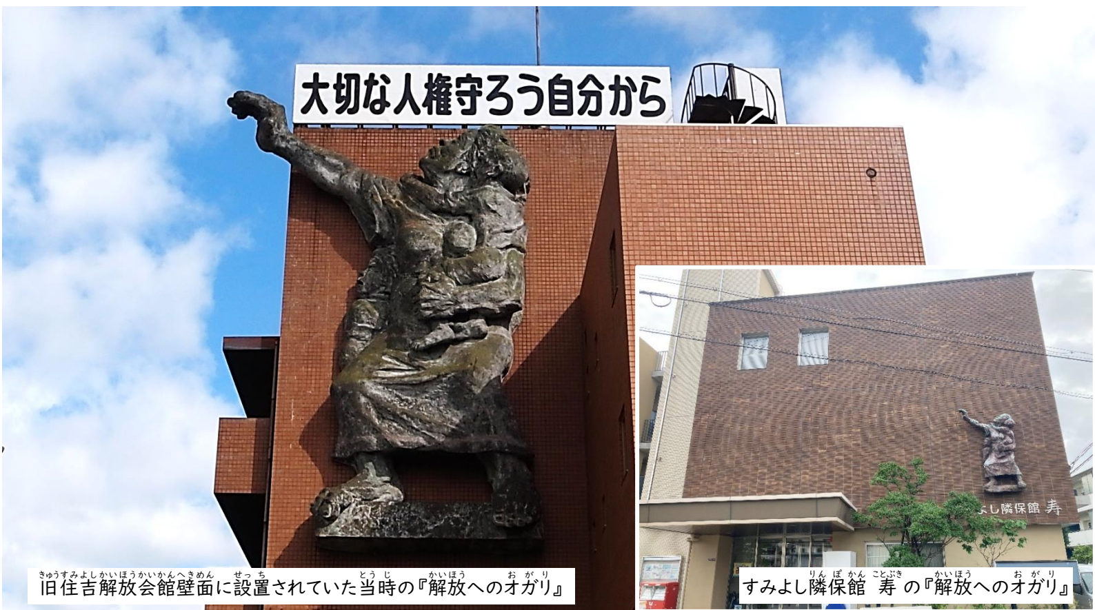
きゅうすみよしかいほうかいかんへきめん せっち とうじ かいほう おがり 旧住吉解放会館壁面に設置されていた当時の『解放へのオガリ』